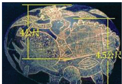
圖：騎恐龍的戰士也很大

在秘魯納斯卡平原北部有一座名為伊卡(ICA)的小村莊有一座石頭博物館。館中陳列著一萬多塊刻有圖案的神秘石頭，被稱為ICA刻石，它們依圖案的類別被劃分為太空星系，遠古動物，史前大陸，遠古大災難等幾類。這種分類與現代科學完全脫節，似乎在談論一個完全嶄新的課題。