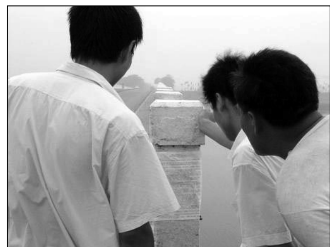
上圖：2005年7月17日津榆公路蘆台大橋橋頭，人們爭相細看如何退黨。