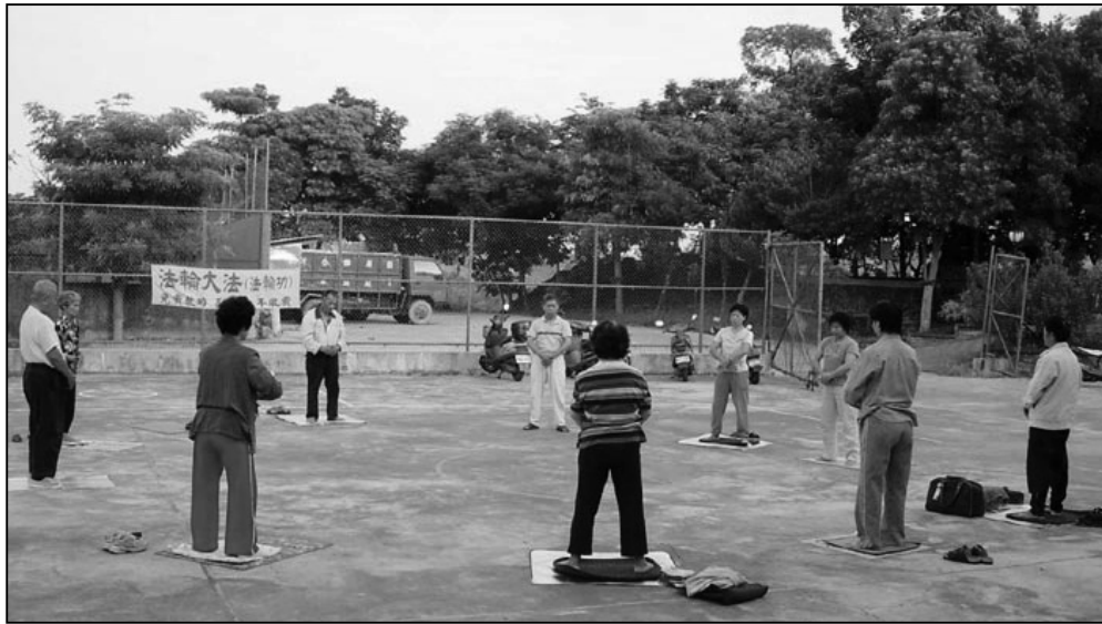
圖：台南縣關廟國小晨間煉功點