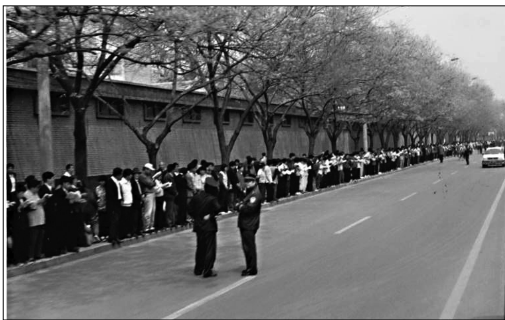
圖：法輪功學員在中南海附近的中央信訪辦上訪，執勤的警察在閒聊。

從1997年起，中央政法委書記羅幹利用手中的權力，命令公安系統在全國秘密調查，企圖尋