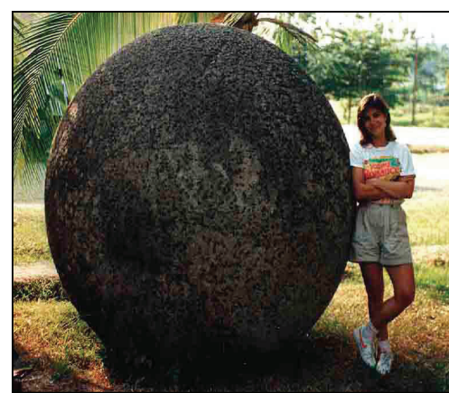
哥斯達黎加巨型石球。

20世紀30年代末，美國人喬治·奇坦在中美洲南部的哥斯達黎加一處人跡罕至的三角洲熱帶叢林以及山谷和山坡上，發現了約200個好似人工雕飾的石球。這些石球大小不等，大的直徑有幾十米，最小的直徑也在兩米以上，製作技藝精湛，堪稱一絕。