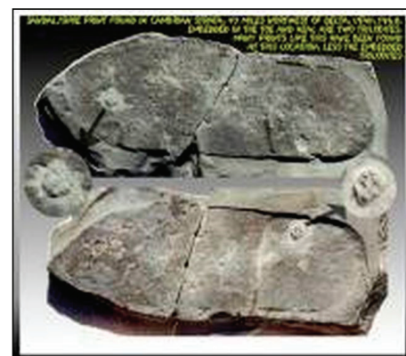
1968年，業餘化石專家米斯特在美國猶他州發現踩在生活於6億年到2億多年前的三葉蟲上的鞋印。

1968年，業餘化石專家米斯特在美國猶他州發現踩在生活於6億年到2億多年前的三葉蟲上的鞋印。