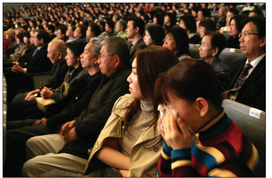
圖：觀看晚會的東京觀眾

在加拿大：一位觀眾說：「可以用我流出平生最有價值的眼淚來表達此刻的心情」。他說，晚會高尚境界的舞蹈構思、服裝色彩斑斕的搭配、歌曲穿透人心的震撼、幕景惟妙惟肖的立體感令我思緒萬千……他說我周圍的一些朋友都喜歡中國的『太極』，但我們幾乎都是比划動作，而少有對中國傳統文化的