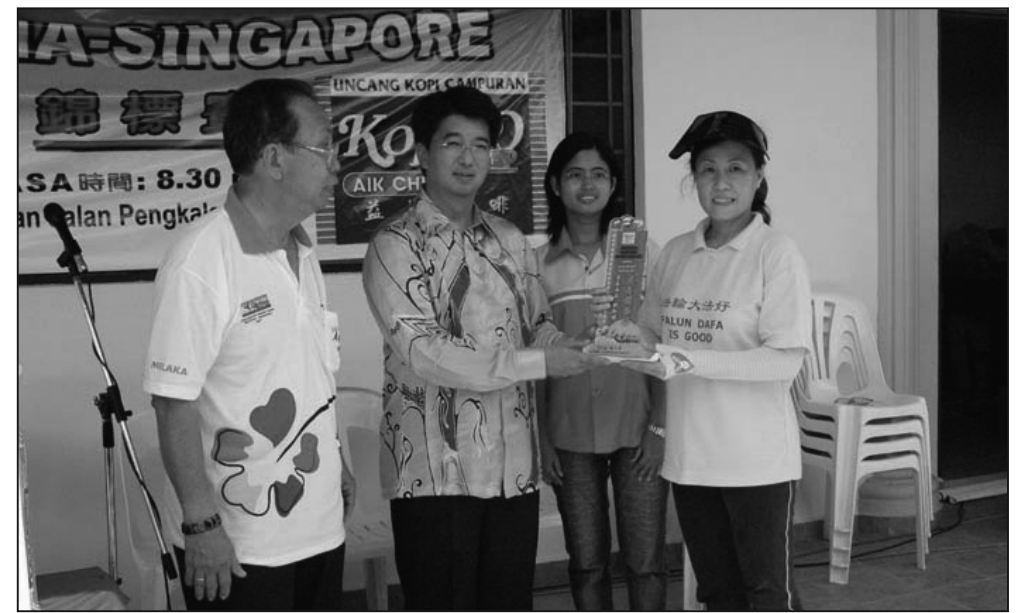
圖：馬來西亞法輪大法學員組成的女子龍舟隊領取季軍獎牌

【明慧週報訊】馬來西亞新加坡龍舟錦標賽五月二十日在馬六甲河畔舉行，由法輪功學員組成的女子龍舟隊獲得季軍。州行政議員、拿督古乃光律師代表馬六甲州首席部長主持開幕兼頒獎儀式。當天早上九時左右，來自台灣大約兩百法輪功學員組成的天國樂團助陣，吹奏「法輪大法好」、「法正乾坤」、「送寶」和「法鼓法號震十方」。震撼人心的鼓樂吸引觀眾圍看和爭相拍攝。學員也在現場擺放了法輪功真相資料、展板。進入決賽的新加坡海鷹龍舟隊和檳城城市花園少年龍舟隊因比賽過程出現肢體碰撞而發生矛盾，主辦者頓時感到難以解決。一位負責人突然想起法輪功，便叫一位法輪功學員轉過身，要看看衣服後面寫著的三個字「真、善、