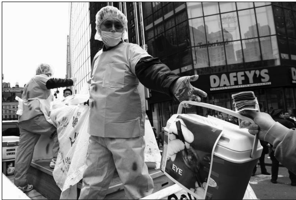
圖：活體摘除法輪功學員器官模擬演示。

「格雷欣法則」是說，如果市場上有兩種貨幣——良幣和劣幣，只要二者所起的流通作用等