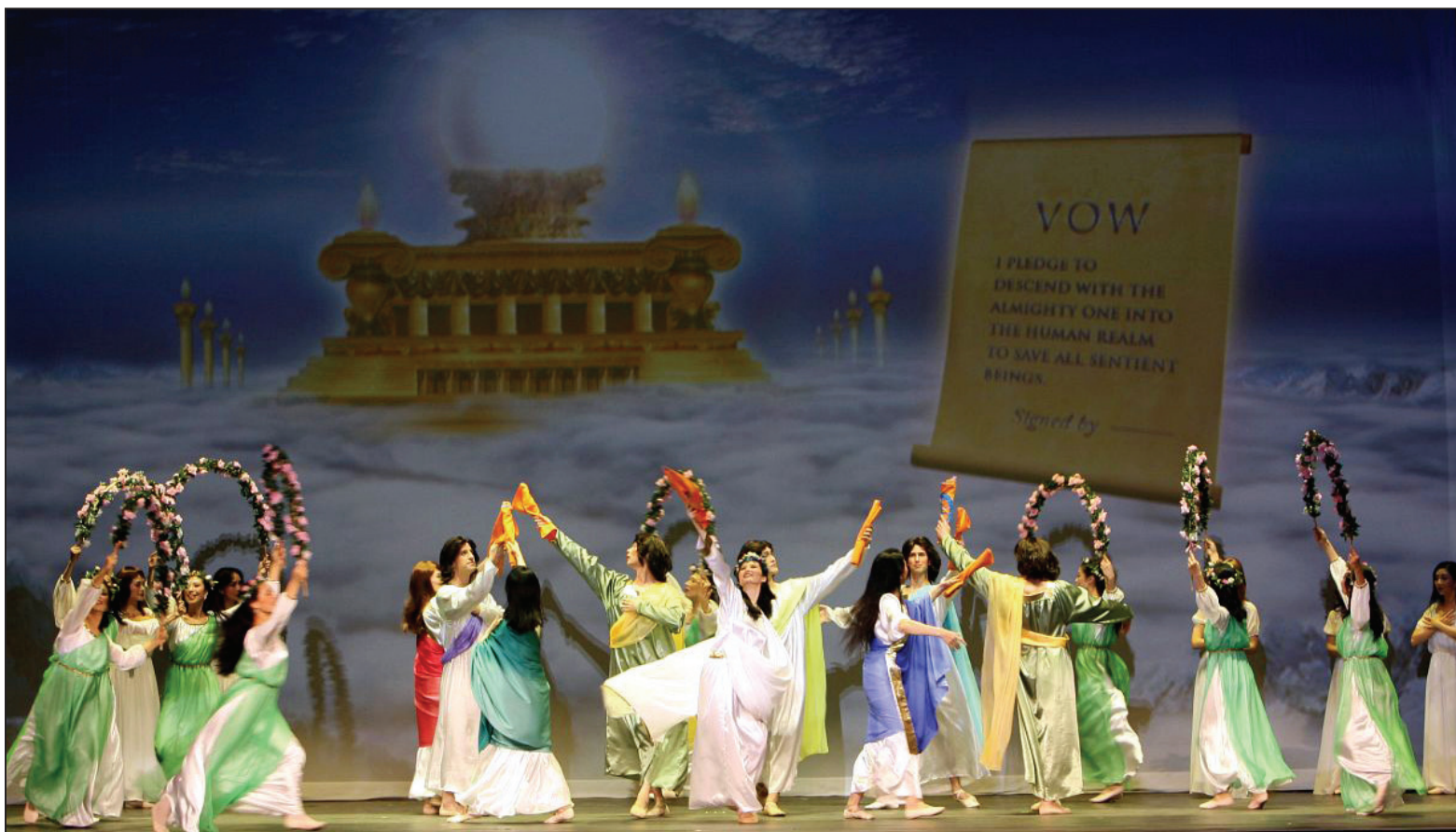
圖：神韻藝術團的舞蹈《誓約》提醒了人們藝術和神的淵緣

人偶以物化的身體模擬傳統舞的形骸；暴力式的民族主義驅使舞者掄起傳統分崩離析的骨架，而其身體透露的黨文化習氣在本質上瓦解了傳統內在的精神。 與此相對，《神韻》之舞給予人肉身復活的激勵。斜披蒙古袍子的男舞者豪邁著華麗的身形，又似威脅又似誘惑地搖晃著雙肩，如同在戰場上半蹲前進，舞出了蒙古族的草原牧歌。他們驟然由膝跪下，腰倒折了仰面把背脊貼上了大地-人的身體矯健、嫵媚的無限可能，它和大地的親密關係，讓人大驚失色。藏袍裹身，水袖如練的女舞者低垂頸子，腰微俯，慎重著每一踏在大地上的步伐，甩出了雪白的，抗拒地心吸力的水袖，舞出了藏族的天山雪蓮。在那一瞬間，我們窺視到了牧馬的蒙古人和高寒地帶宗教感強烈的藏人對待自身生命獨特而莊嚴的方式。