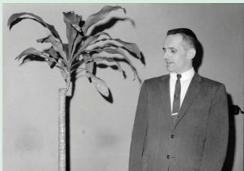
圖：巴克斯特和牛舌蘭花

1973年，彼得·托姆金斯和克里斯朵夫·伯得的《植物生命奧秘》(The Secret Life