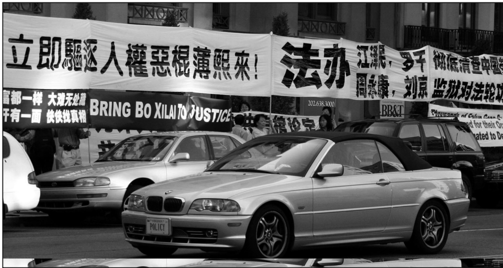
圖：華府法輪功學員抗議人權惡棍薄熙來的活動現場。