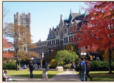
讓我的美國夢不僅僅是為我自己(第五版)