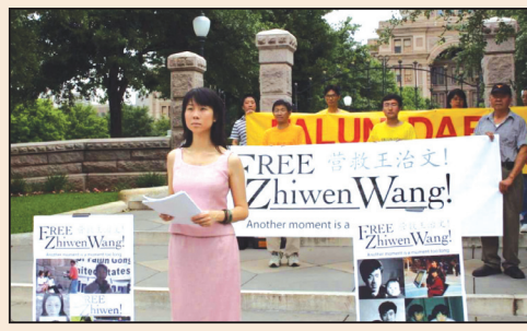
不一樣的父親節(第六版)