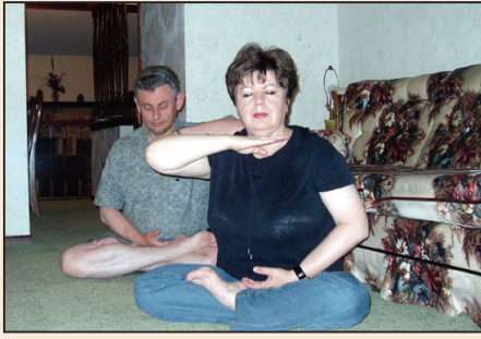
烏克蘭猶太裔家庭的故事(第四版)