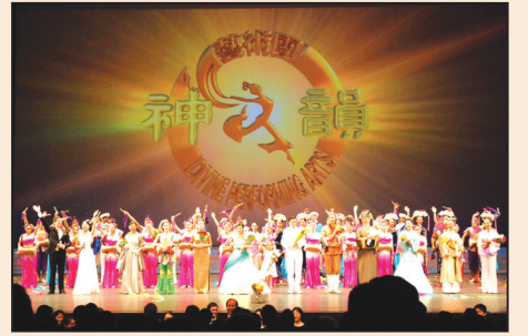
中國繪畫和舞蹈中的韻味(第八版)