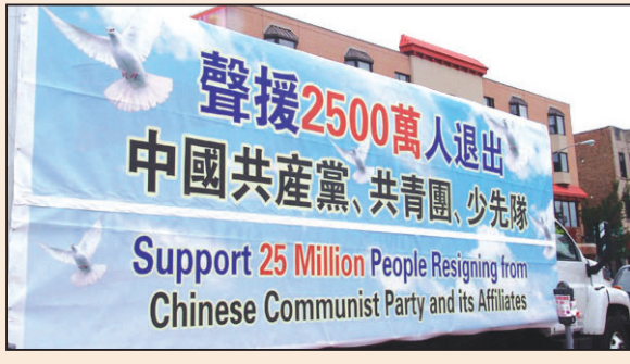
聲援二千五百萬人退出中共(第七版)