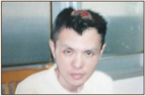
上海提籃橋監獄殘害大法弟子(第二版)