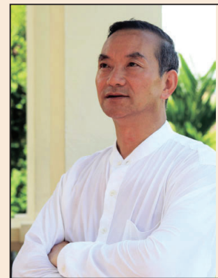
千萬富翁控訴江澤民(第六版)