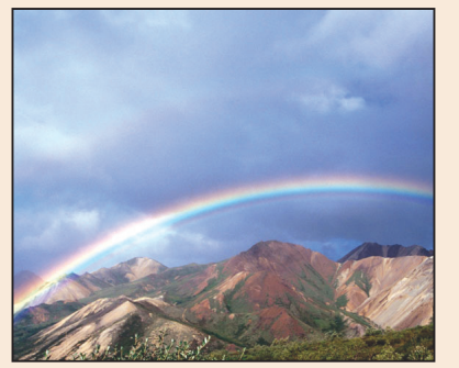
彩虹從心底升起(第五版)