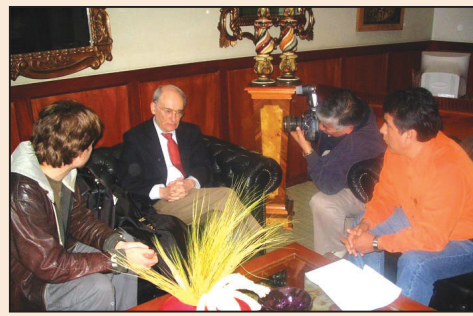
秘魯譴責中共活摘器官暴行(第七版)