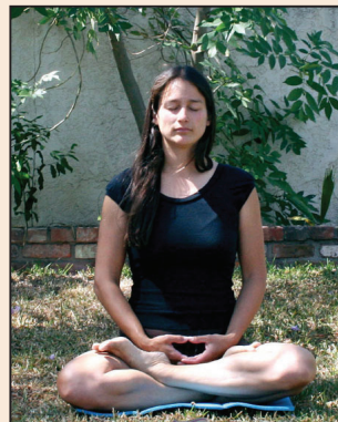
一位洋女子與大法 之緣(第四版)