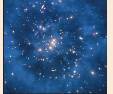
宇宙加速膨脹挑戰科學對時空的認識(第八版)