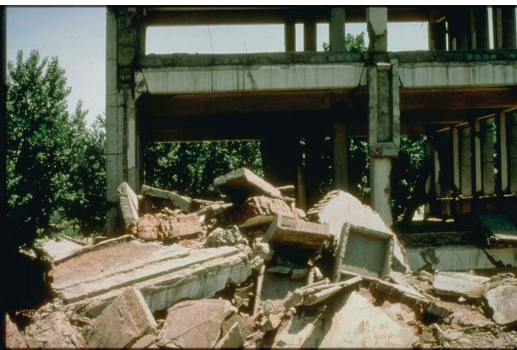
圖：唐山地震後殘存的斷壁殘垣