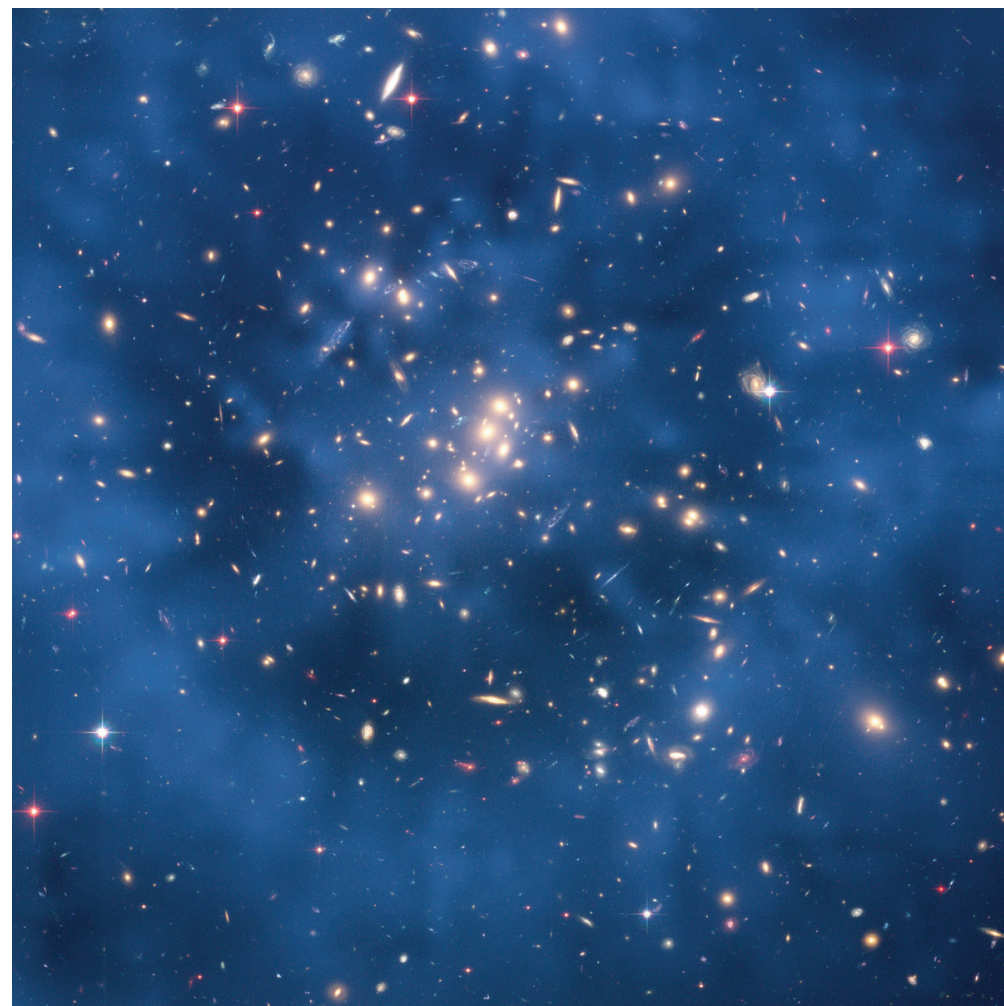
圖：哈勃望遠鏡拍攝的代號為CL0024+17的星系團合成照片。照片顯示出環狀結構的暗物質造成的引力透鏡效應。

總之，宇宙的加速膨脹挑戰目前科學對時空和生命的認識。據美國《新科學家》雜誌報導，二零零五年十二月，在比利時召開的一次極負盛譽的關於「大統一理論」的物理學會議上，加州大學理論物理學家、諾貝爾物理學獎獲得者大衛·格羅斯（David Gross）坦承：「我們不知道我們在說什麼。」他說物理學現在處於「一個完全混亂的時期」，現在物理學可能缺少一個根本的東西。這個根本的東西是什麼？作