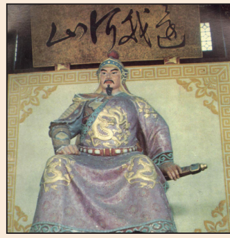
精忠報國 浩氣長存 (第五版)