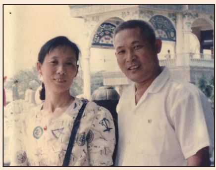
中秋佳節難團圓 (第二版)