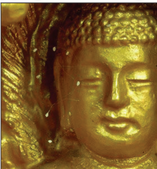
韓國全羅南道順天市海龍面的須彌山禪院的佛像上長出的優曇婆羅花

在中國大陸中共的新聞媒體也首次報導優曇婆羅花開，實際上默認佛經中的記載是真實的，承認有佛的存在，這與中共一貫鼓吹的「迷信」「無神論」相抵觸。然而，曾經在中國大陸