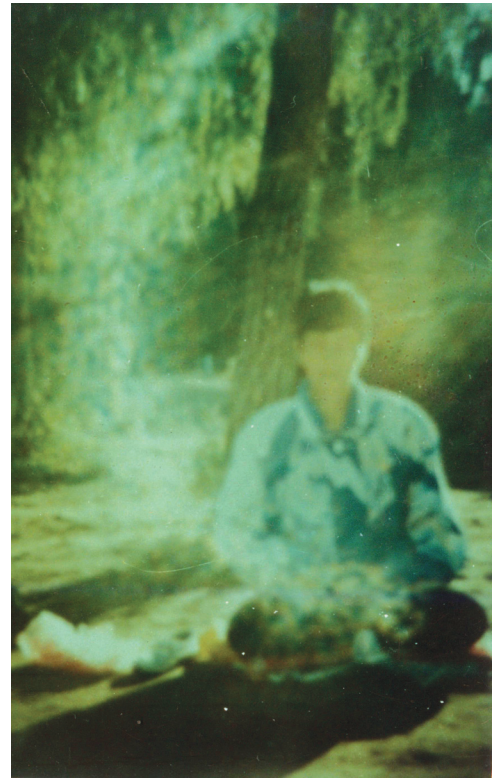
圖：一位法輪功學員在早上煉靜功

人在另外物質空間有相應的身體，另外物質空間及其裡面的生命和物質是真實存在的。這將