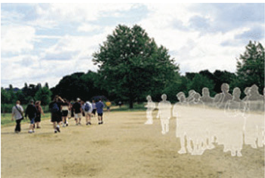
圖：多世界理論認為「另一個我」的示意圖。