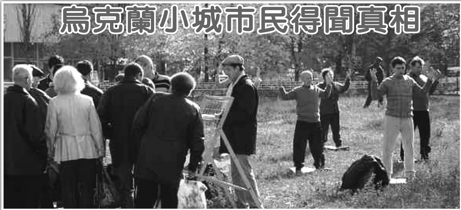
圖：人們詳細的了解法輪功以及發生在中國的迫害情況

【明慧週報訊】2007年10月28日，烏克蘭法輪功學員來到小城傑米托洛瓦市，向人們介紹教人「真善忍」的法輪功，揭露中共對法輪功的殘酷迫害。