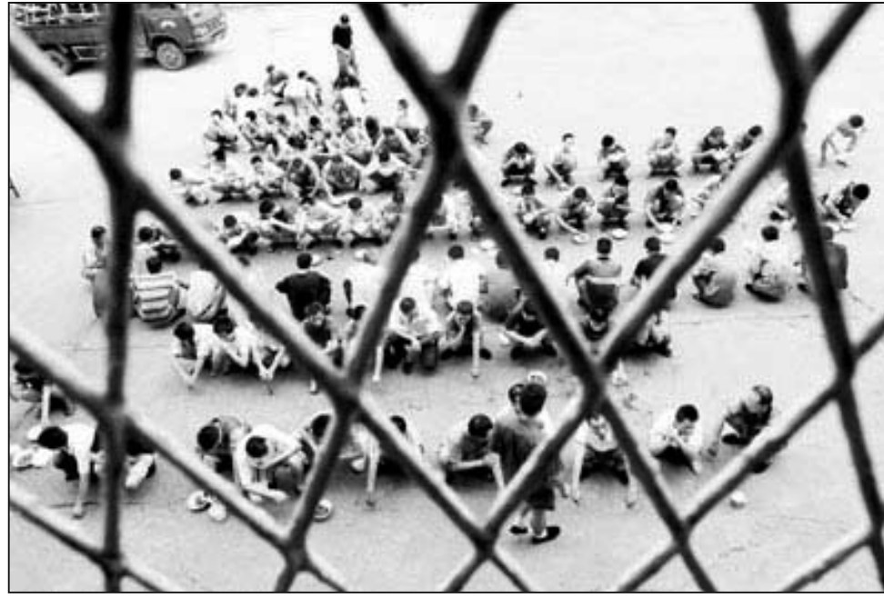
圖：勞教所內的勞教人員

「違法行為矯治法草案」和勞教制度並無本質的區別。根據參與修改的人士所說，無非是改了個名字，決定勞教的仍然是公安機關，只是被勞教人員對決定不服可以申辯，可以到法院申訴，稍微瞭解一點中國上訪人員遭遇的，都知道這個申辯毫無意