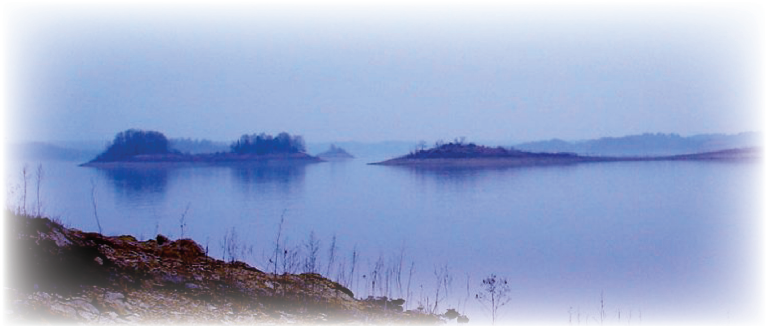
圖：今湖北鐘祥的莫愁湖，以楚地民歌高手莫愁女命名