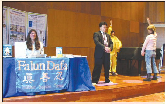
法輪功應邀參加劍橋活動 (第四版)