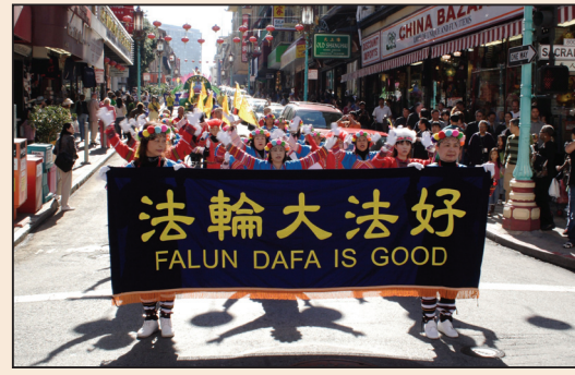
法輪功舊金山遊行 (第七版)