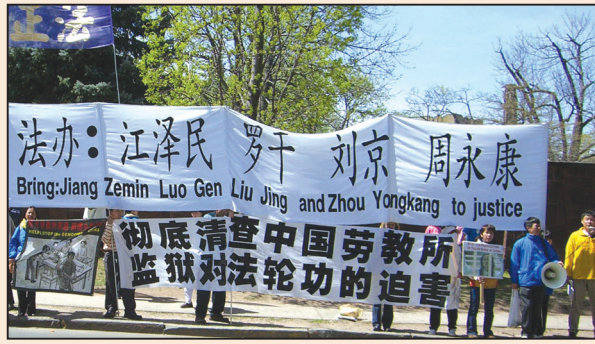
並不複雜的邏輯 (第三版)