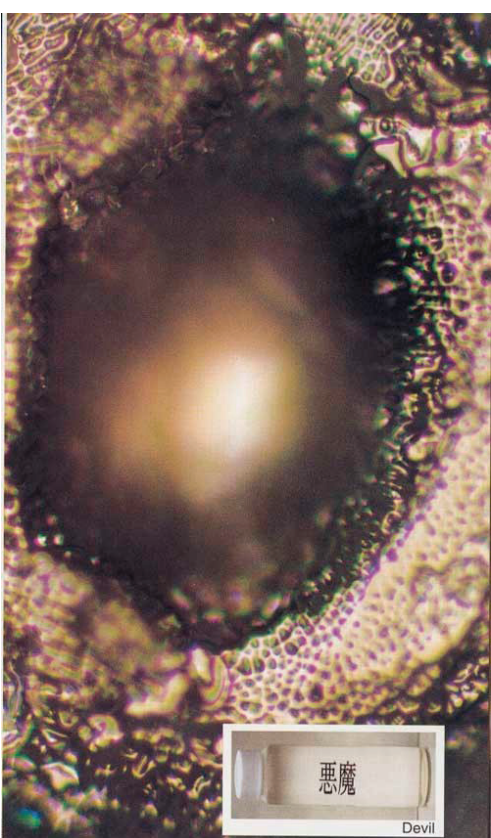
貼上「惡魔」字樣之後所觀察到的水結晶

著名的「水結晶試驗」是在1994年由日本勝先生在他的IHM研究所產生的，他們讓水在瞬間低溫下結成象冰一樣的固態，在冷房中用高速攝影機拍攝下來水的結晶過程。首先他們以蒸餾水為對照樣本，然後對它播放不同的音樂，結果，聽過優美音樂的水