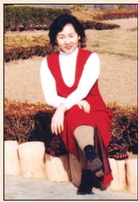
女企業家女兒的求助信(上)(第八版)