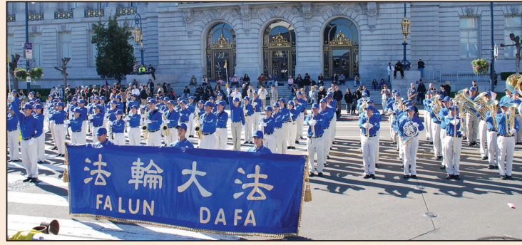
美國老兵節遊行 法輪大法受歡迎(第七版)