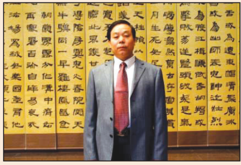
青島市書法家因辦書法展被捕 (第二版)