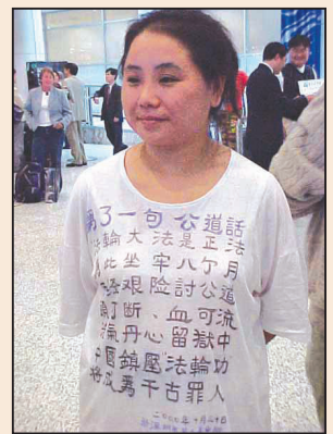
女畫家廷為起訴羅幹案出庭作證 (第七版)