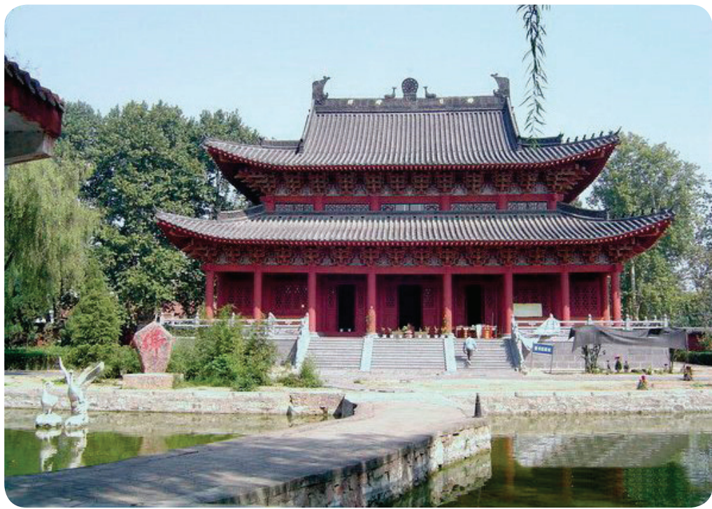
中國第一古刹：洛陽白馬寺

古埃及、古巴比倫、古波斯和古希臘的文明香火也許隨著亞述、波斯、希臘、馬其頓和羅馬帝國的武力征服而相互融合，並在東羅馬帝國保留了下來。中間雖然經過長達一千年神權至上、政教合一的中世紀，古希臘的文明還是隨著奧斯曼帝國的入侵而在公元十四世紀從歐洲全面復興