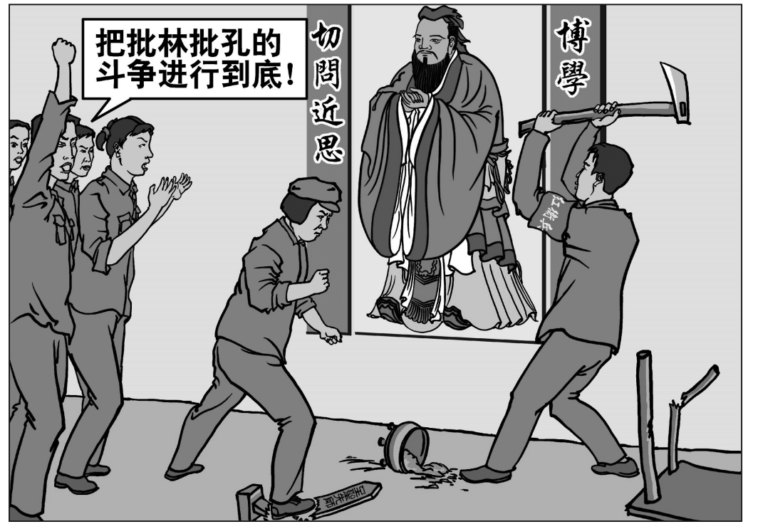
圖：反對中華文化才是真正的反華勢力

1949年以後，除台灣外，國內沒有「反華勢力」，也沒有反共勢力，就是那些被共產黨打倒的人或團體，也都是忠於共產黨的，是擁護和熱愛共產黨的。如：劉少奇、鄧小平、四人幫、張志新等。左派擁護共產黨，右派也是擁護共產黨的；造反派擁護共產黨，走資派也是擁護共產黨的；鎮壓學生運動的士兵是擁