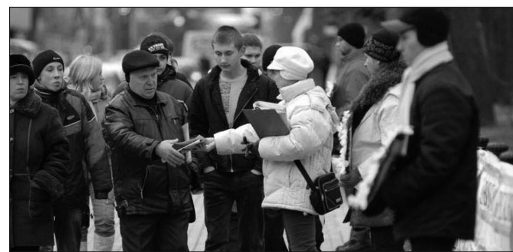
圖：向人們散發真相資料

當天天氣雖然寒冷，空中飄著小雪，但這並沒有影響學員在中使館前舉行活動。為了儘快制止這場恐怖的罪惡、制止中共通過中使館向海外散佈謠言，一年半來烏克蘭