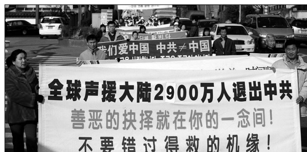
圖：韓國清南道安山市遊行慶祝二千九百萬退出中共

已過花甲之年的老軍人還說，自己參加過「珍寶島戰役」和「越南反擊戰」，為中共賣命多年，八九年「六四」時自己剛好在北京，親眼目睹中共屠殺學生。當時駐京部隊一位軍長，拒