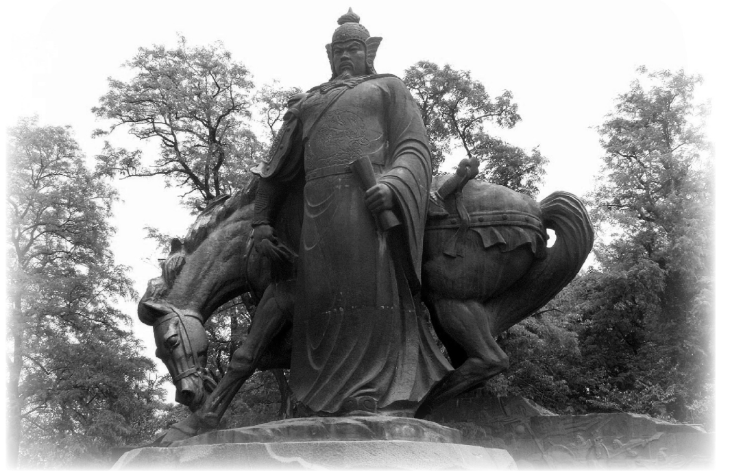
岳飛雕像，武漢黃鶴樓後

在岳飛的嚴厲教導下，其兒子岳雲年紀輕輕便驍勇善戰，屢立戰功。在著名的潁昌之戰中，