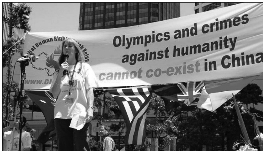
圖：奧克蘭市議會議員凱西博士：讓我們進入中國去調查真相