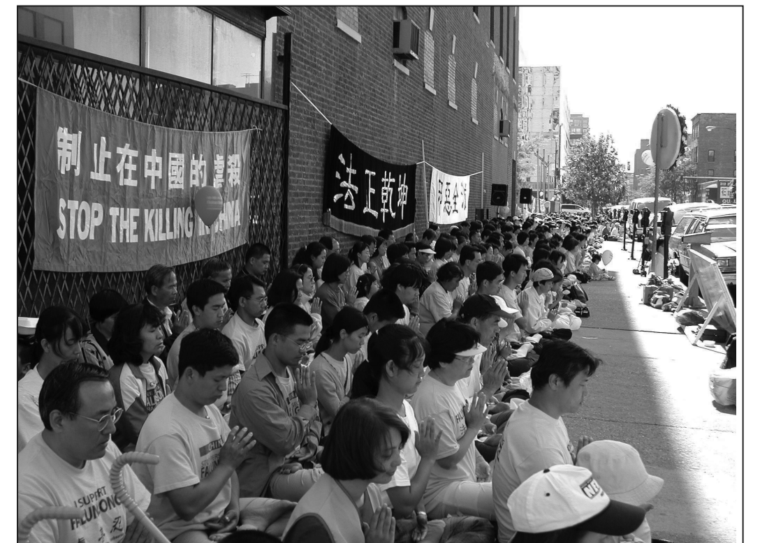
圖：法輪功學員在芝加哥中領館前，呼籲停止迫害法輪功 2001-06

薩費爾寫道，「我在寫文章時，看見了一隊法輪功修煉者，那是被共產黨統治者鎮壓的一個修煉團體。他們穿著黃色的煉功服，動