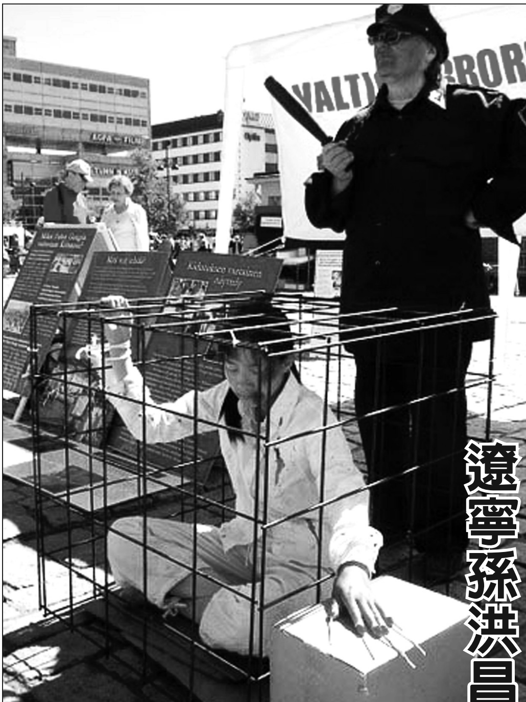
圖：手指釘竹籤（海外法輪功學員反酷刑展）