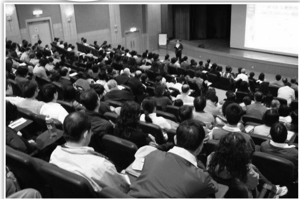
上圖：學員上台分享上網講真相的心得