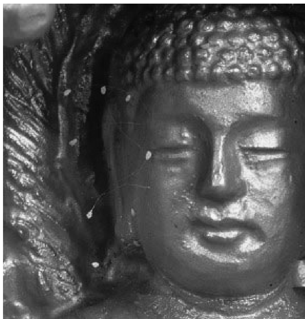
圖：韓國全羅南道順天市海龍面的須彌山禪院的佛像上長出的優曇婆羅花

有人曾用菌類或苔蘚類植物推擋，但根本無法解釋奇花在各種非常規物質中皆能生長的事實，也說不出有如此能耐的菌類