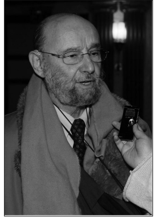
圖：美國加州大學洛杉磯分校心理學教授（Roderic Gorney）說：「晚會中傳遞的真誠、善良的信息跨越種族，是所有人都應遵循的美德。是東西方共同的價值觀。」

信仰和法律約束，沒有媒體言論自由監督的中國，而物慾橫流的「金錢拜物」成爲主旋律，成爲「國教」，其發展走向能可怕嗎？