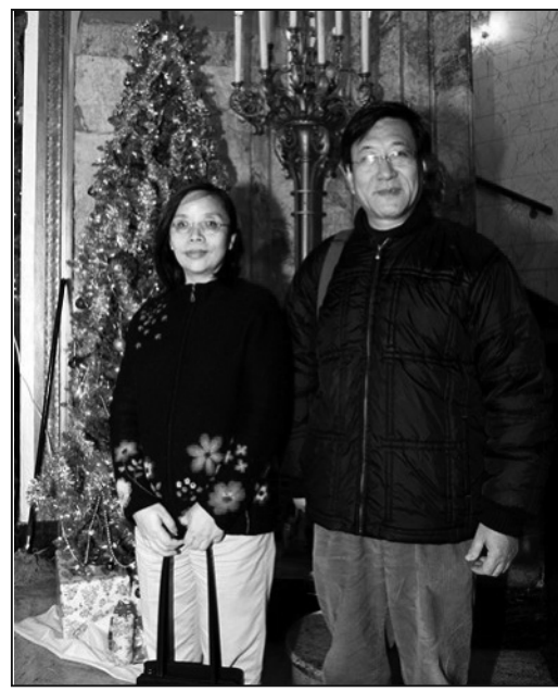
圖：著名社會經濟學家程曉農及何清漣夫婦觀看十九日的紐約聖誕晚會說，晚會開關文化藝術的新時代，新的藝術形式耳目一新。

…… 二零零七年末中國某知名電視主持因同為電視主持的丈夫在外亂搞而大鬧中央電視台，成為大陸網絡上最熱門的話題。當事人在過程中反覆引證了一位法國外交官說過的話——「如果中國不能輸出價值觀的話，是不可能成爲一個大國的。」——從而，也引出了關於「價值觀」的討論。作爲一個整體，這個社會喪失了傳統的價值觀。充斥世界的廉價產品的出口，並不能給中國帶來一個真正大國的形象。