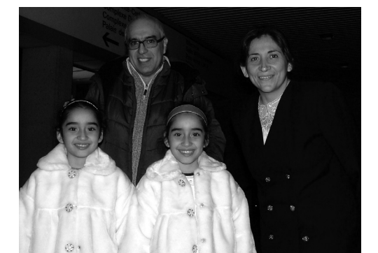
麥吉爾大學的美術客座教授與夫人帶著一對雙胞胎女兒來看晚會。

蒙特利爾最大的法語日報《La Presse》一月十七日在藝術專版發表題目是《中國新年晚會展現文化精髓》的文章，向讀者推介