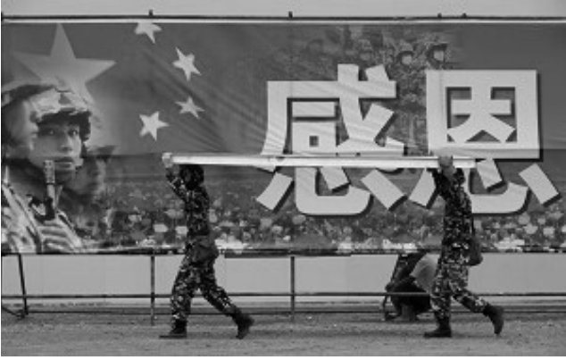
把喪事當作喜事辦，是中共的一貫手段

這些年來，共產主義的信仰破滅了，中國人沒有了信仰，要說有，那就是「發財掙錢」成爲了信仰，這也是中國社會道德日益下滑的根本原因。一場大地震，讓很多人變得無私起來，獻血、捐款、志願者服務……人性