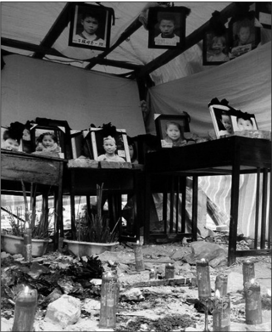
綿竹富新鎮二小在地震中死去的孩子們。富新鎮上其他房子都沒有倒塌，除了這所小學……

走進四川地震災區，你會看到垮塌最嚴重的是學校教學樓，死傷最慘重的是孩子們。看到成千上萬的孩子頃刻間被埋在廢墟下，鮮活的笑容從此隨風凋落，人們在痛心疾首之餘，或問：是誰奪走了孩子們的生命，是誰埋葬了孩子們的夢想？