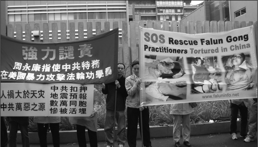
悉尼法輪功學員六月五日中領館前集會抗議中共暴行

員很高興得知紐約的警方對法輪功學員提供了安全保護，以及美國國會議員提出的驅逐中共駐紐約總領事的要求。」他介紹說：「這位警官表示，警方的職責是