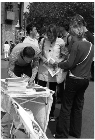
右圖：法輪功學員舉辦抗議中共迫害的活動

許多人在「全球百萬簽名反迫害」請願信上簽了名。「全球百萬簽名反迫害」是由「法輪功受迫害真相聯合調查團」（CIPFG）發起的，旨在要求中共停止迫害法輪功。